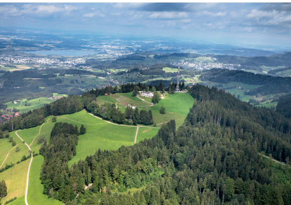
Il Bachtel, fotografato dall'alto. Dalla piattaforma la veduta è altrettanto spettacolare.

Restaurant Bachtel Kulm, 044 937 33 88, www.bachtel-kulm.ch Konditorei Volland, Steg, 055 265 11 30, www.baumerfladen.ch