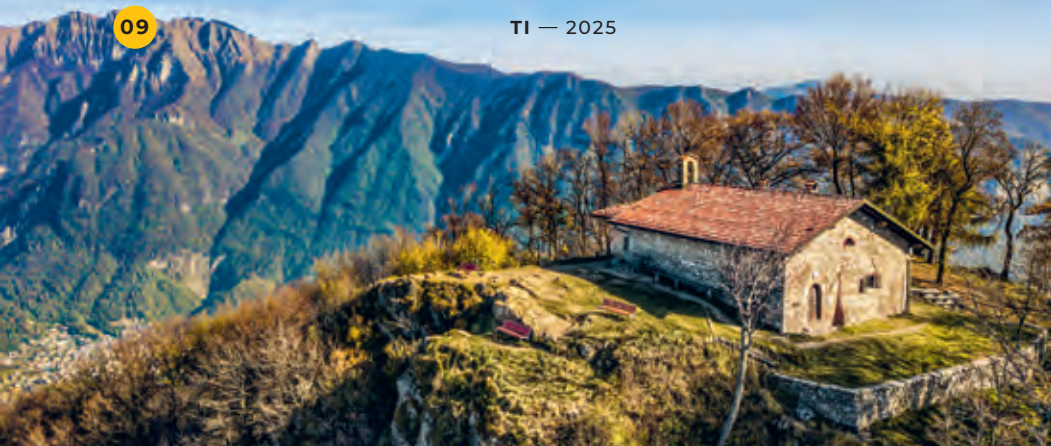
L'Oratorio di San Giorgio au sommet du Monte San Giorgio.