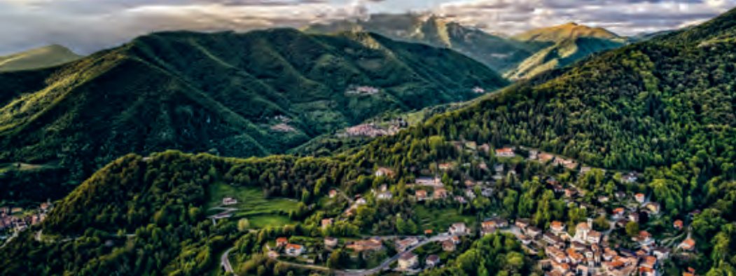
Vue sur la Valle di Muggio. En bas à droite se trouve le village Sagno.