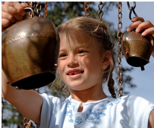
...la scène des cloches offrent une diversité captivante.