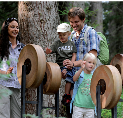
Les installations musicales comme les moulins de sons...

Bergbahnen Wildhaus AG, 071 998 50 50, www.wildhaus.ch