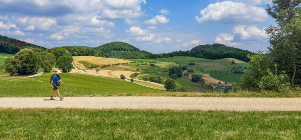
Auf den weiten Jurahöhen bei Kilholz.