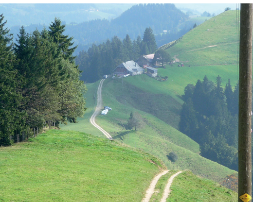
Gratwandern auf der Emmentaler Panoramawanderung.

Ein Wanderbus nach und ab Lüderenalp sowie nach und ab Mettlenalp am Napf verkehrt am Sonntag und Samstag (seit 2016) von Mai bis Oktober, www.bls.ch ; ansonsten mit dem Taxi.