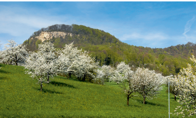
Zur Zeit der Kirschblüte im Frühling ist die Region im Baselland besonders attraktiv. Im Hintergrund blinzelt die Sissacherflue.

Hof Baregg, 061 981 63 48, www.hof-baregg.ch Restaurant Sissacherfluh, 061 971 13 71, www.sissacherfluh.ch