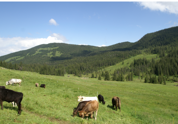
Solch ein Blick ins Schlierental eröffnet sich Wander/innen auf dieser Route.

Bergrestaurant Schwendi-Kaltbad, 6063 Stalden, 041 675 21 41, www.kaltbad.ch . Eine Panoramakarte mit dieser Route ist hier erhältlich.