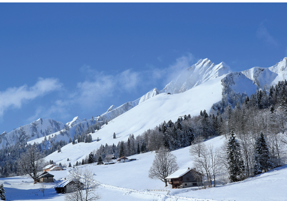
Die flache Geländeschulter der Prés d'Albeuve. Darüber die schönen, weiten Alpweiden unterhalb des Dent de Lys.