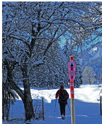
Nach vier Anstiegen sind die Prés d'Albeuve erreicht.