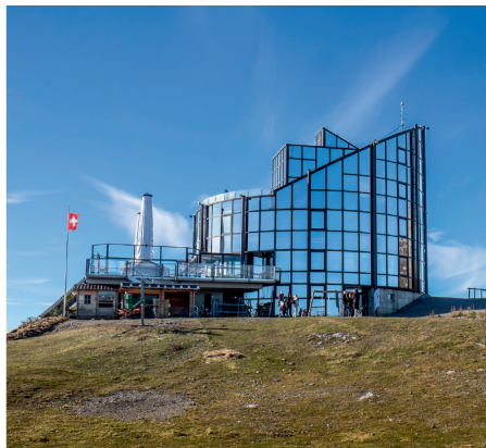
Links: Blick Richtung Oldenhorn und Les Diablerets. Rechts: Auf der Berneuse thront das Drehrestaurant Le Kuklos.