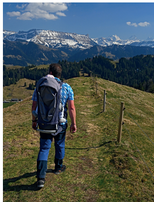
Auf der Wanderung blickt man zur Schratteflue.