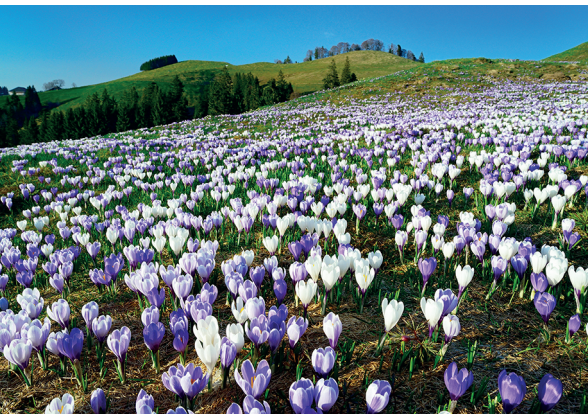
Ein Meer von Krokussen am Rämisgummehoger.

Restaurant Rosengarten, Wiggen, 041 486 12 75